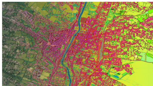
OSC GE, Auch (32)

L'occupation du sol est un enjeu clé de la transition écologique. A la demande du gouvernement, l'IGN s'est lancé dans un programme ambitieux de production de données automatisées par intelligence artificielle (IA). L'objectif ? Des données d'occupation du sol cohérentes au niveau national, livrées à intervalle rapproché, et en concertation étroite avec les territoires, pour une couverture France entière d'ici 2024. Les premières ressources sur le département du Gers (32) sont aujourd'hui disponibles. L'occasion pour chacun de s'en saisir et de les enrichir.